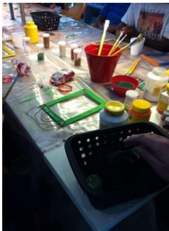
Figura 7. Decorando molduras