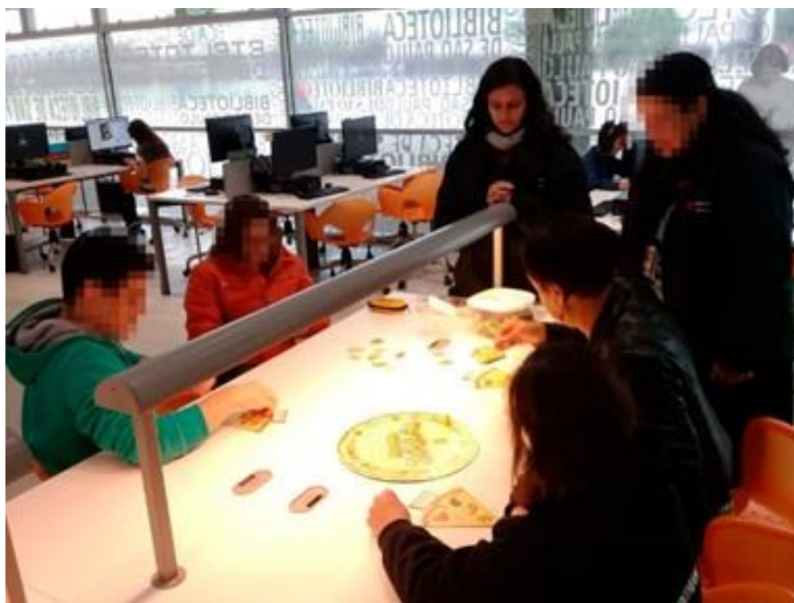
Figura 1. Jogando Pizzaria maluca

Com a atividade foi estimulado a ter paciência, a lidar com a frustração e perseverança para concluir o jogo.