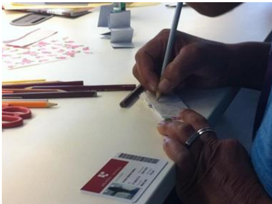
Figura 3. Desenhando no mini livro