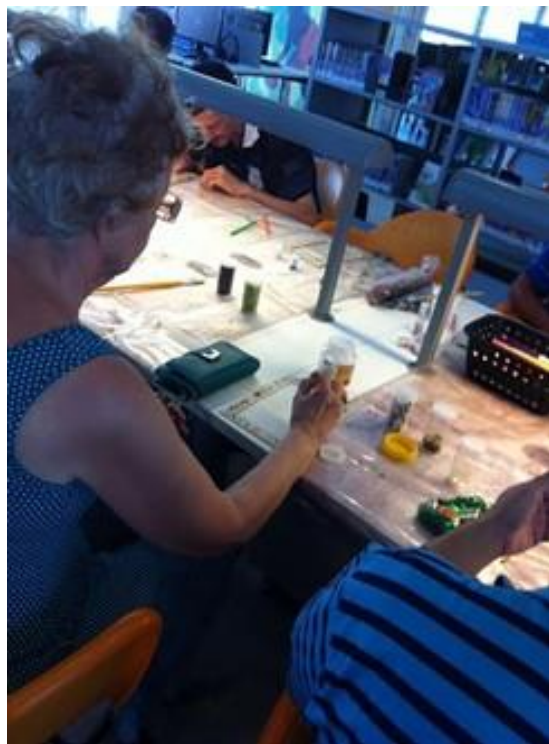
Figura 6. Decorando molduras

Dez participantes e dois acompanhantes. Atividade propôs a decoração de molduras, para enfeitar uma das tendas existente na biblioteca conhecida como “tenda da poesia”. As molduras enfeitadas fariam parte da exposição sobre o dia internacional da mulher, o tema foi discutido com o grupo antes da confecção. Com essa atividade foi visado o aprimoramento dos conhecimentos gerais, resgate de memória, coordenação motora, organização mental e interação com o grupo.