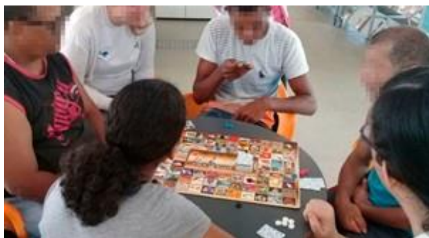
Figura 4. Jogando charada II

Cinco participantes e três acompanhantes. O jogo funciona assim: através das pistas nas cartas, a jogador localiza no tabuleiro a imagem da charada. Deve ser rápido, pois todos os participantes terão a mesma chance. A atividade estimula a concentração e o aproveitamento máximo da capacidade de raciocínio, proporcionando maior rapidez mental.