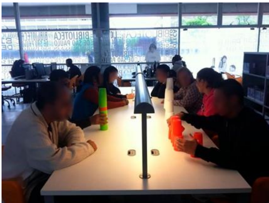
Figura 2. Jogo empilhar copos