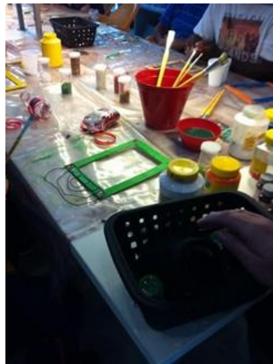
Figura 7. Decorando molduras